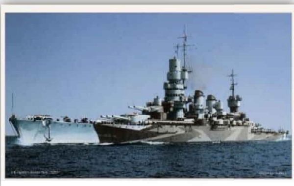
Imbarcati per un certo periodo sulla Regia Nave Caio Duilio ( a sinistra )